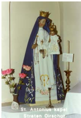
Mariabeeld waarvan medaille in de zomer van 2003 is ontvreemd.

Speelde het bestuur voor de festiviteiten al met de gedachte om een stichting op te richten, in 1954 wordt daar daadwerkelijk werk van gemaakt, waarbij de kapel met meubilair en alle grond, o.a. die van "Hanneke" en een perceel met houtopstand plus bleekkuil in de buurt van de oude school ( de zgn. Bleek) ondergebracht wordt in de Stichting St. Antoniuskapel.