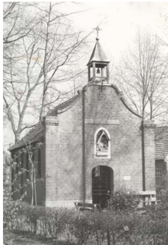
De Sint Anooniuskapel in 1991 met in de nis boven de deur een gipsen plaquette van Sint Joris

D it liedje, behorend bij een verstop- en vangspelletje, zongen wij in onze jeugd, ondertussen spiedend naar de zich verstopte "wolf". Wat die wolf met het "kepèlleke te maken had, wist ik niet, maar wel dat met dat kepèlleke 't Stratens kapelleke werd bedoeld.